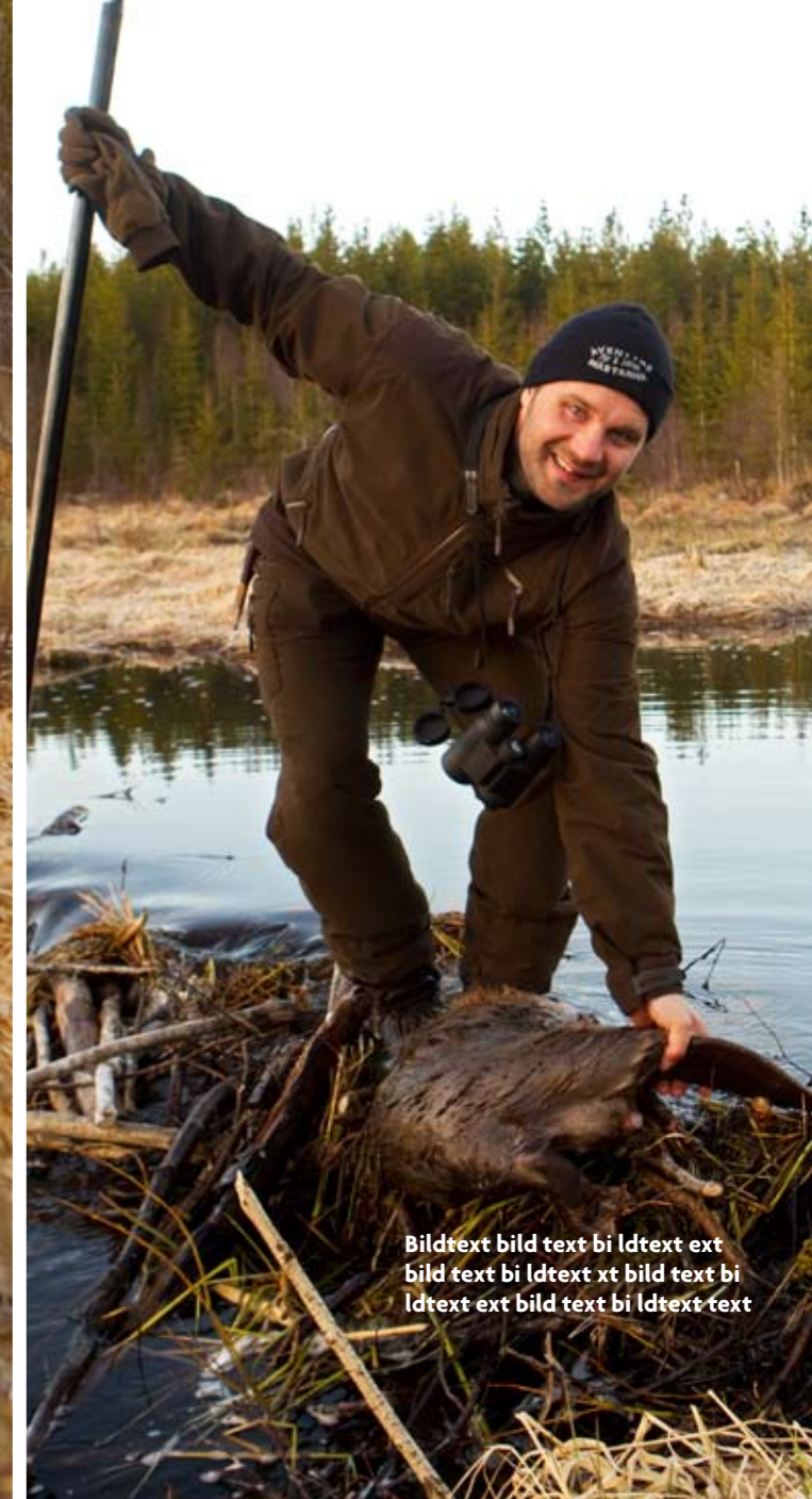
Bildtext bild text bi ldtext ext bild text bi ldtext xt bild text bi ldtext ext bild text bi ldtext text

– Där, nästan på samma ställe som den dök. ►